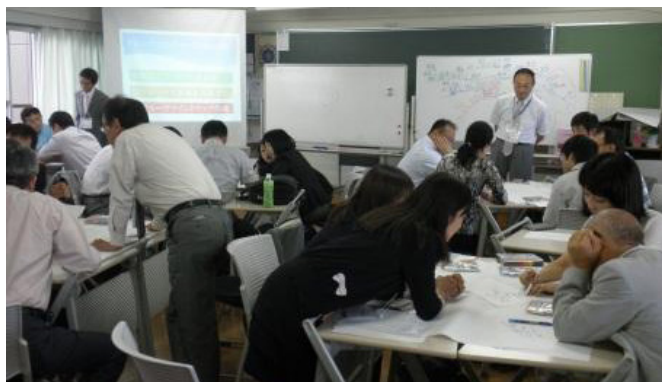
マインドマップのワークショップ風景